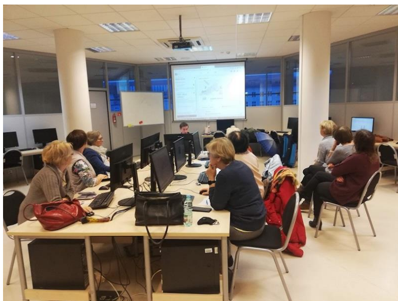
Rys.5. Spotkanie integracyjne dla polskich seniorów na Wydziale Elektroniki Telekomunikacji i Informatyki Politechniki Gdańskiej, 18.11.2021