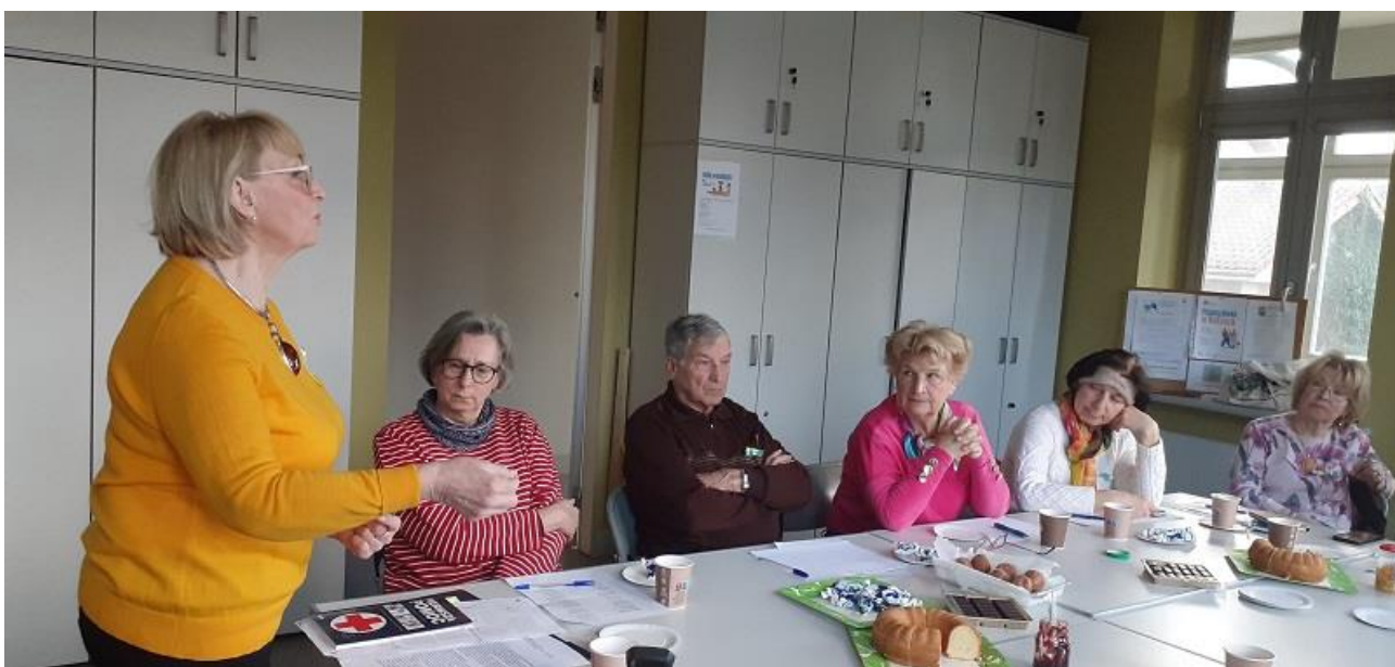
Rys.8. Warsztaty „Jak opiekować się osobą chorą oraz radzenie sobie w trudnych sytuacjach”