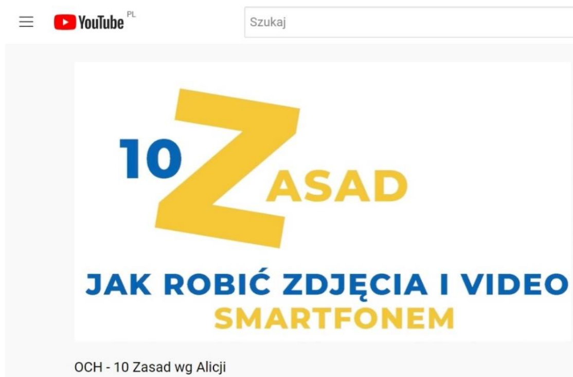
Rys.1. Dodatkowe warsztaty integracyjne dotyczące tworzenia filmików na smartfonie.

Korzystny efekt edukacyjny przynieść może dodatkowe spotkanie integracyjne/warsztaty, poświęcone tworzeniu filmików na smartfonie. Do prowadzenia takich warsztatów wystarczą smartfony i wolontariusz, na przykład Latający Animator Kultury. Filmiki szkoleniowe dla osób zainteresowanych przeprowadzeniem szkolenia umieszczono na kanale YouTube Integracja Polskich Seniorów i Opiekunek z Ukrainy- Opowiadanie Cyfrowych Historii .