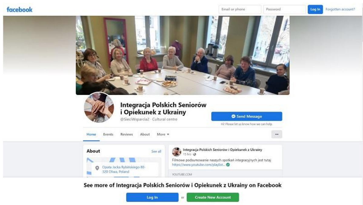
Rys.2. Fanpage Integracja Polskich Seniorów i Opiekunek z Ukrainy

W związku z wybuchem konfliktu zbrojnego w Ukrainie fanpage wspiera dzielenie się informacjami na temat oferowanej pomocy dla uchodźców.